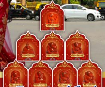
พระพิฆเนศ 8 องค์ เมืองปูเน่