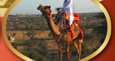
ฟรี ขี่อูฐ เมืองมันทาวา ราคาเริ่มต้น