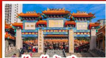
วัดเซ่งเต้าเซียน

วัดเจ้าแม่กวนอิมฮ่องฮำ - กระเช้านองปิง พระใหญ่โป่วหลิน - เจ้าแม่กวนอิมรพิลส์เบย์ วัดเซกตงเหมียว - วัดหวังต้าเซียน - วัดเจ้าแม่ทับทิม