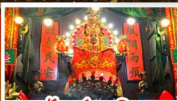
วัดเซกตงเหมียว