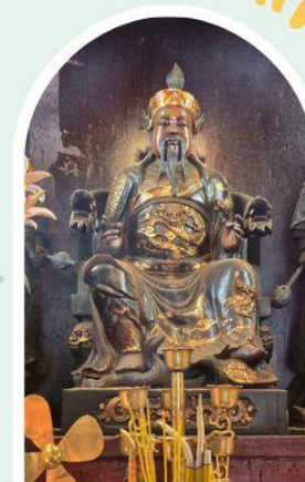
วัดปักไต้