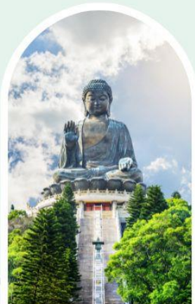
พระใหญ่โป่หลิน