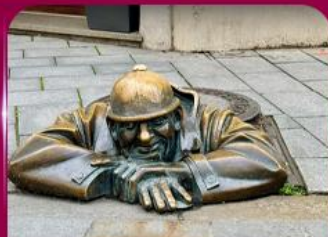
เซลฟี่คู่คูมีล บราติสลาวา