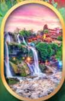
ฟูหลงเจินน้ำตก