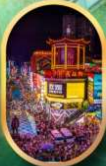
ถนนคนเดินซิงสู่