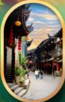
เมืองโบราณฟูหลงเจิน