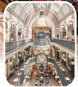
QUEEN VICTORIA BUILDING