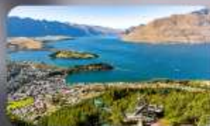
นั่ง Skyline สู่ Bob's Peak