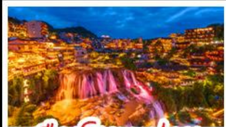
เมืองโบราณฟูตรง

เมืองโบราณฟิ่งหวง - เมืองโบราณฟูหรง หงหยาดัง - ประตูลั่วจื่อ - รถไฟทะลุคด