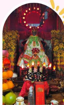
วัดเจ้าแม่กวนอิมอ่องอ่า ขอพรเรื่องเงิน ทรัพย์สิน และความมั่งคั่ง