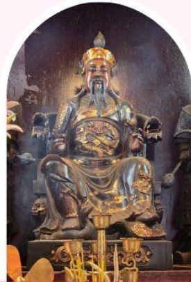
วัดปักโต เสริมโชคลาก นำพาความรุ่งเรือง