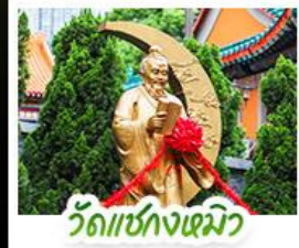
วัดเขangkหมิง