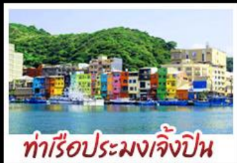
ทำเรือประมงเจิ้งปิ่น

รถไฟสายโบราณอาลีซาน - ตึกไทเป 101 ประมงเจิ้งปิ่น - จิวเฟิ่น - ล่องเรือทะเลสาบสุริยันจันทรา ถนนเมบูเค็ด เสี่ยวหลงเป่า & ปลายประธาราธิบดี ช้อปปิ้ง 3 ย่านดัง : ซีเหมินดิง - ไถจงไนท์มาร์เก็ต - MITSUI OUTLET