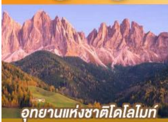
อุทยานแห่งชาติโดโลไมท์

ขึ้นเครื่องบินตรงอัมสเตอร์ดัม กับเส้นทางสายโรแมนติก พร้อมการแสดงพื้นบ้านสไตล์ที่โรเลียนสุดพิเศษ