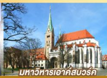
มหาวิหารเอาก์สเวิร์ค