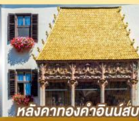
หลังคาทองคำอินน์ส์บรุค