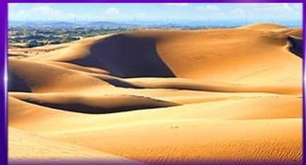
ทะเลทรายอินเคินทาลา