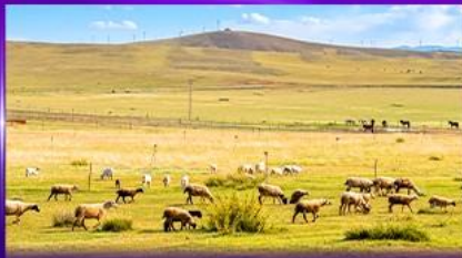
ทุ่งหญ้าชลามูเหมิน