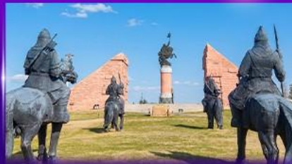
สวนสาธารณะเจงกิสข่าน