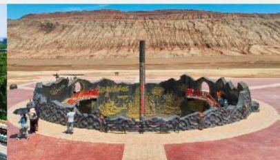
ภูเขาเปลวเพลิง

*ทางบริษัทฯ ขอสงวนสิทธิ์ในการสลับโปรแกรมทัวร์ตามความเหมาะสมขึ้นอยู่กับสถานการณ์หน้างาน โดยคำนึงถึงผลประโยชน์ของลูกค้าเป็นสำคัญ