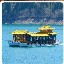
ล่องเรือทะเลสาบเทียนจื่อ