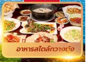
อาหารสตรีทกวางตุ้ง