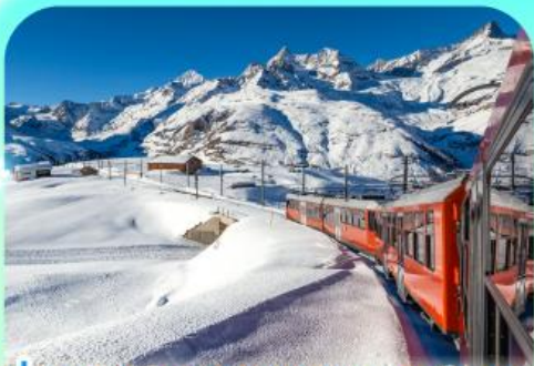
นั่งรถไฟสู่ยอดเขารอนเนอร์แตร