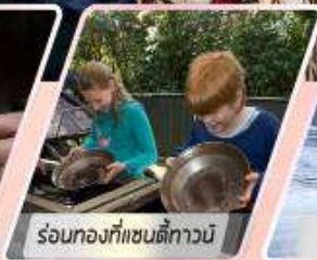
ร่อนทองที่แซนด์บีกานี