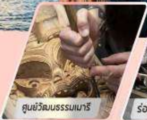
ศูนย์วัฒนธรรมเมารี

เที่ยวเกาะใต้ และเกาะเหนือ : 12 วัน 10 คืน