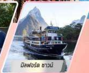
มิลฟอร์ด ซาวนี