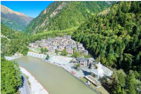
หมู่บ้านทิเบตหยิงหวงฮาเต๋อ

รับประทานอาหารกลางวัน ณ ร้านอาหารพื้นเมือง (8)