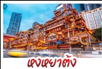
เจียงหยาดัง

อุทยานหลุมบ่อฟ้า - อุทยานเขานางฟ้า หงหยาดัง - นั่งรถไฟทะเลสาบ - อุทยานสี่ดรุณี ปี่ผิงโก้ว - สะพานหนานเฉียว