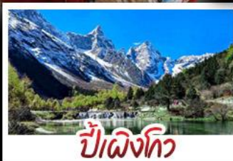
ปี่ผิงโก้ว