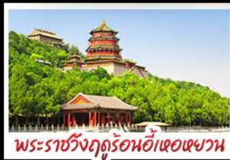
พระราชวังฤดูร้อนอ้าหอยหวง

ท่าแพงเมืองจินค่านจวียงกวน - พระราชวังฤดูร้อนอ้าหอยหวง สวนจิ้งอัน - วัดลามะ - โมเดลร้านช้อปปิ้ง - โรงแรม 4 ดาว มือพิเศษ เปิดปีกกึ่ง สุกี่มองโท MICHELIN GUIDE ร้าน TAO TAO JU