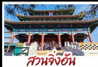
สวนจิ้งอัน