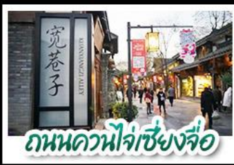
ถนนควนโจ้วเซียงจื่อ