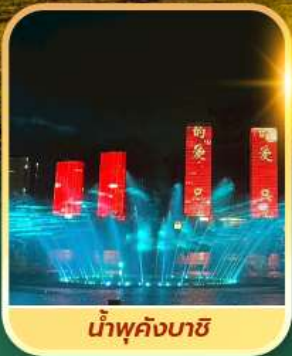
น้ำพุคังบาซี