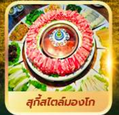
สุกีสโตลมองโก