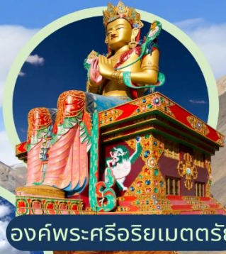
องค์พระศรีอริยเมตตรีย์