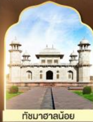
ถ้ำมาฮาลันย