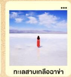
ทะเลสาบเกลือฉ่า