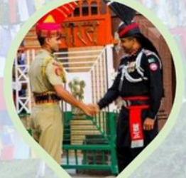
พิธีลดธงพระแดน อินเดีย-ปากีสถาน ชายแดนวากา (Wagah border)