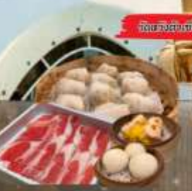
จัดของว่างแถม