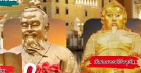
วัดของขงจื้อ