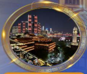
มือคำร้านอาหารวิวหลักล้าน