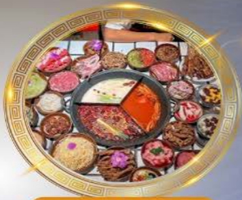
บุฟเฟ่ต์มือโพล่งซิ่ง