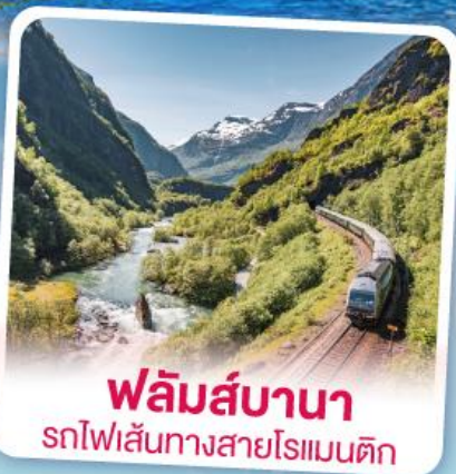
พหลิมส์บานา รถไฟเส้นทางสายโรแมนติก