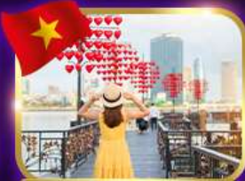
เช็คอินสะพานแห่งความรัก