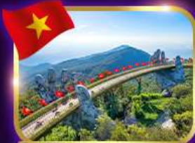
สะพานมือสีทอง บานาฮิลล์

เวียดนาม ดานัง ฮอยอัน พักบานาฮิลล์ 4วัน3คืน เดินทาง เม.ย. - มิ.ย. 69