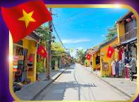
เมืองเก่ามรดกโลก ฮอยอัน