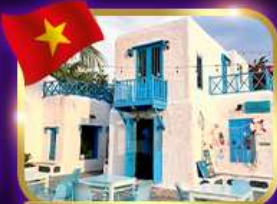
คาเฟ่สุดชิค ซานทรา มารีน่า