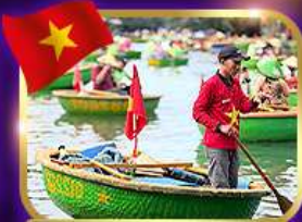
เรือกระด้ง หมู่บ้านก๊อบกาน