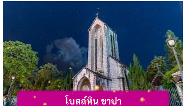
โบสถ์หิน ซาปา