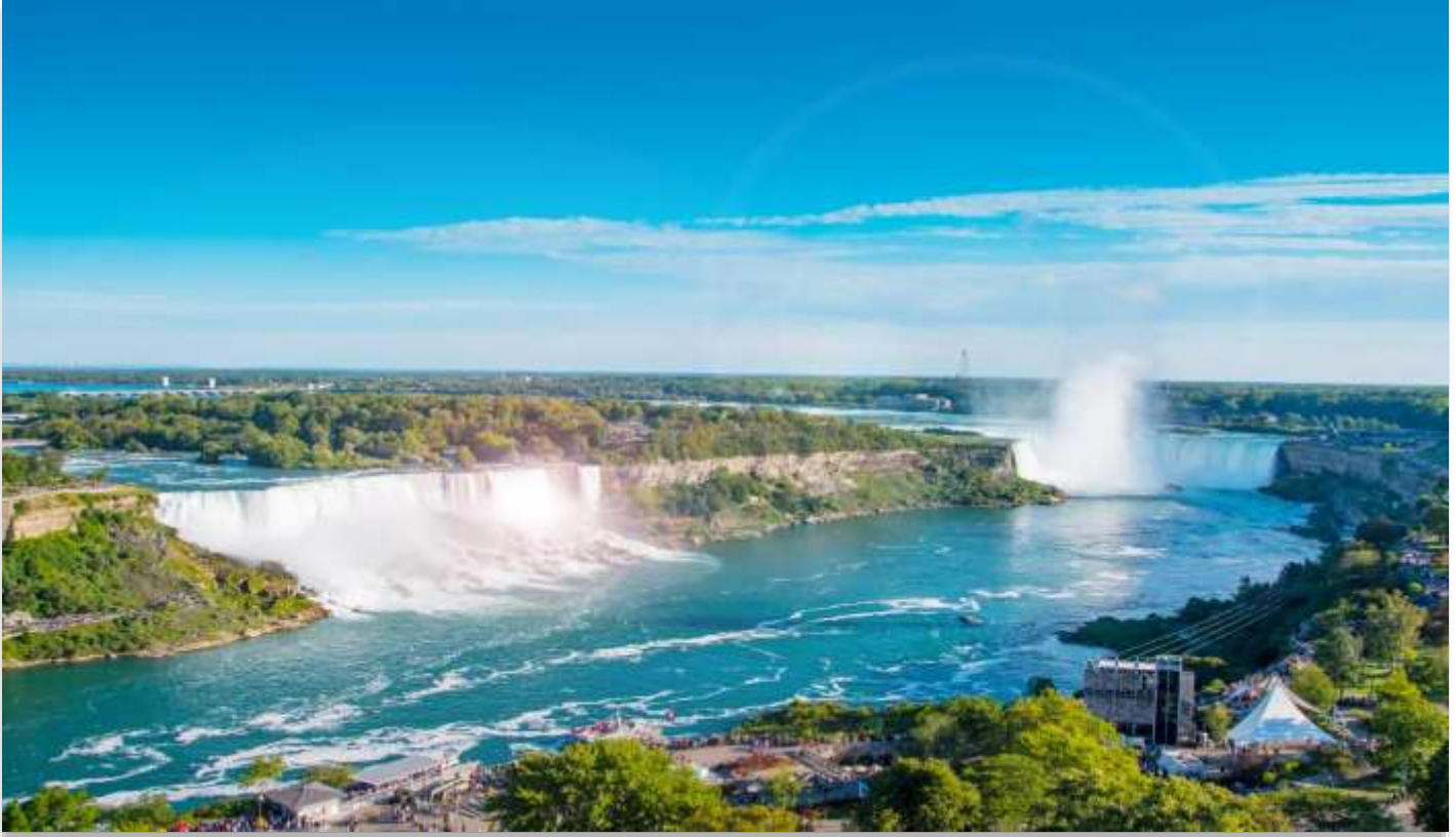
NIAGARA FALLS STATE PARK

นำท่านเดินทางสู่ “อุทยานแห่งชาติไนแอกการ่า” (Niagara Falls State Park) ฝั่งสหรัฐอเมริกา หนึ่งในสิ่งมหัศจรรย์ทางธรรมชาติของโลก ที่ได้รับการยกย่องให้เป็นสถานที่ท่องเที่ยวยอดนิยม และเป็นหนึ่งในสามจุดหมายปลายทางสุดโรแมนติกสำหรับการดื่มด่ำผิงพระจันทร์ของคู่บ่าวสาวชาวอเมริกัน น้ำตกไนแอก