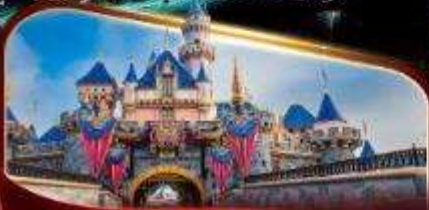
ดิสนีย์แลนด์พาร์ค