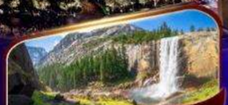
อุทยานแห่งชาติโยเซมิตี