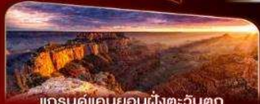
แกรนด์แคนยอนฝั่งตะวันตก

พักลาสเวกัส 2 คืน เต็มอิ่มกับแสงสีแห่งอเมริกา