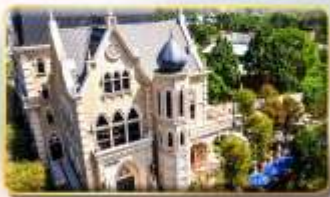
ปราสาทช็อคโกแลตนี้น่า

เมืองซีจี้ หรือเทียบเท่า 3-4* สามารถดูรูปได้ครับ เมืองโกจง หรือเทียบเท่า 3-4* สามารถดูรูปได้ครับ เมืองไทเป หรือเทียบเท่า 3-4* สามารถดูรูปได้ครับ