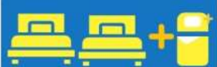
เตียง 3 ก้น ที่นอนเสริม TRIPLE