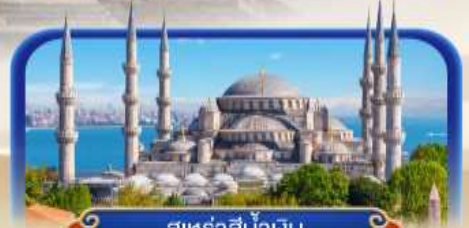
สุเหร่าสีน้ำเงิน

เที่ยวเมืองอันติลยา บรรยากาศริมทะเลเมดิเตอร์เรเนียน พร้อมเข้าชมสวนเทพนิยายซาฮาวา บินภายใน 1 ชมไม่ย้อนเส้นทาง