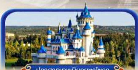
ปราสาทเทพนิยายซาฮาวา