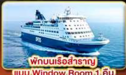
พักผ่อนเรือสำราญ แบบ Window Room 1 คืน

สัมผัสความเป็นที่สดุของ สแกนดิเนเวีย ให้ท่านได้พักผ่อนแบบ SLOW LIFE