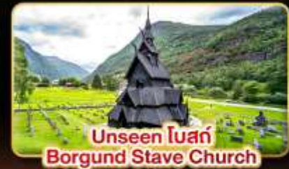
Unseen โบสถ์ Borgund Stave Church