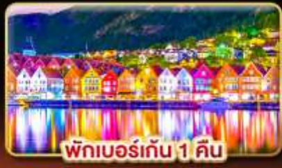
พักเบอร์เกน 1 คืน