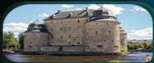
ปราสาทโอเรโบ