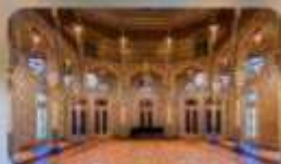
Palacio the Bolsa