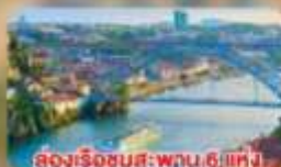
ล่องเรือชมสะพาน 6 แห่ง ในคูร์เมืองปอร์โต