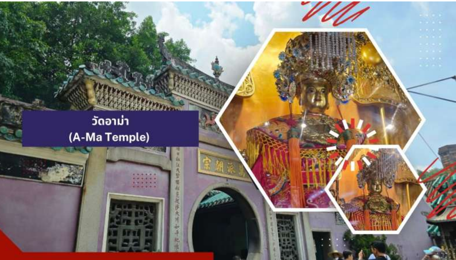
วัดอาม่า (A-Ma Temple)

นำท่านเดินทางสู่ วัดอาม่า (A-Ma Temple) ให้ทุกท่านได้กราบไหว้เจ้าแม่ทับทิม ซึ่งเป็นวัดที่มีชื่อเสียงมากๆ สำหรับวัดแห่งนี้ตั้งอยู่ ใกล้กับทะเล ภายในวัดดูแล้วก็แปลกตาดีเพราะว่ามีการก่อสร้างกันแบบลัดหล่นกันไปตามพื้นที่ที่อำนวยการ เนื่องจากสถานที่แห่งนี้ตั้งอยู่ริมเชิงเขา เมื่อเดินพันซุ่มประตูก็จะพบกับศาลของเจ้าแม่ทับทิมตั้งอยู่นอกจากนั้นก็ยังมี หอเมตตารธรรม ศาลเจ้าแม่กวนอิม ศาลพุทธเซ็นเจ้าชานหลินและยังมีศาลเจ้าขนาดเล็กๆ อีกหลายศาลที่ได้มีการสร้างเพื่อถวายให้แก่เจ้าแม่ทับทิม