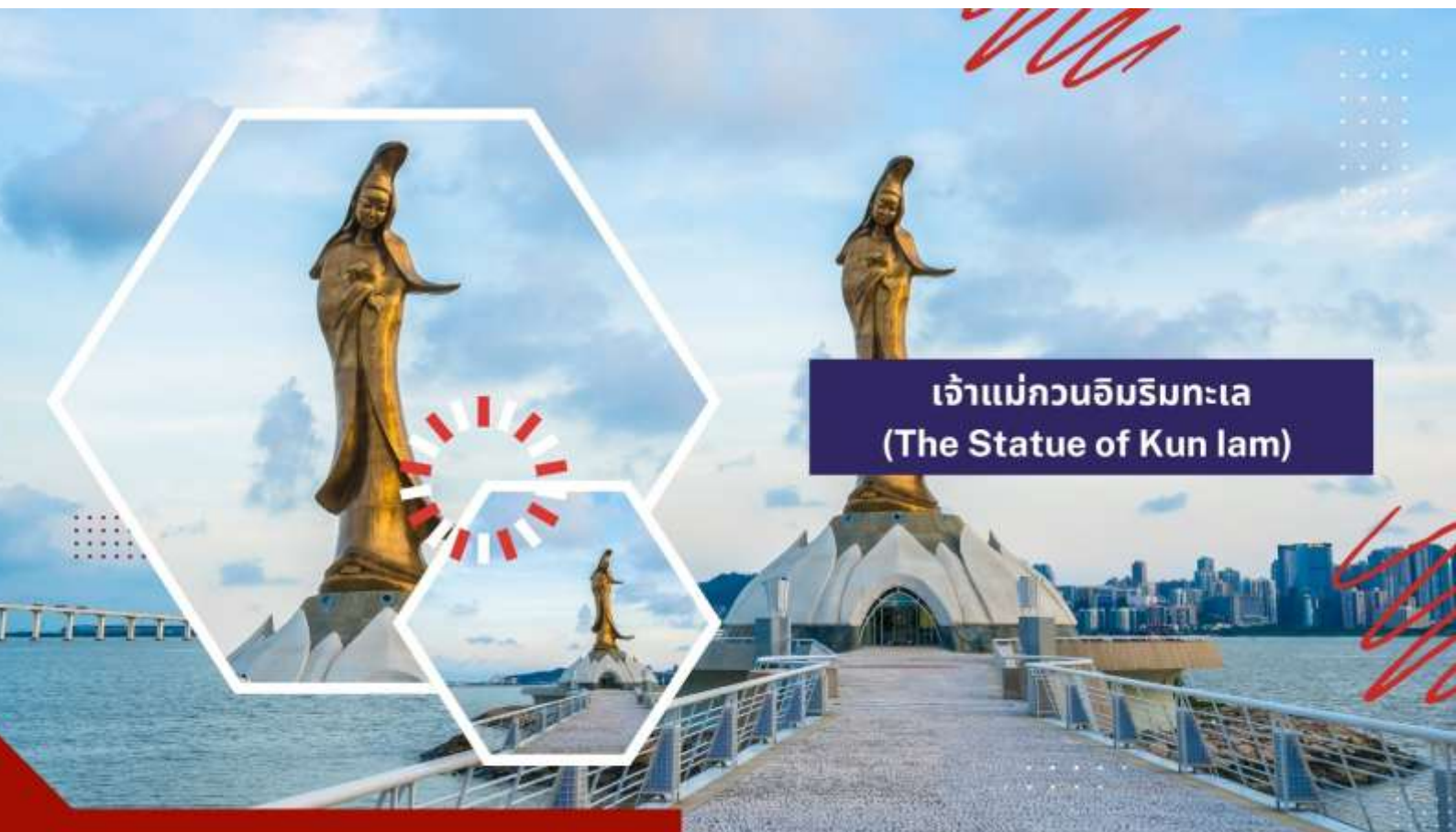
เจ้าแม่กวนอิมริมทะเล (The Statue of Kun lam)

นำท่านชม เจ้าแม่กวนอิมริมทะเล (The Statue of Kun lam) เจ้าแม่กวนอิมปรางค์ทองสร้างด้วยทองสัมฤทธิ์ทั้งองค์ มีความสูง 18 เมตร หนักกว่า 1.8 ตัน ประดิษฐานอยู่บนฐานดอกบัวงดงามอ่อนช้อย สะท้อนกับแดดเป็นประกายเรืองรองเหลืองอร่ามงดงาม จับตา เจ้าแม่กวนอิมองค์นี้เป็นเจ้าแม่กวนอิมลูกครึ่ง คือ ปั้นเป็นองค์เจ้าแม่กวนอิมแต่กลับมีพระพักตร์เป็นหน้าพระแม่มาริที่เป็นเช่นนี้ก็เพราะว่าเป็นเจ้าแม่กวนอิมไปตุเกสตั้งใจสร้างขึ้นเพื่อเป็นอนุสรณ์ให้กับมาเก๊าในโอกาสที่ส่งมอบมาเก๊าคืนให้กับจีน