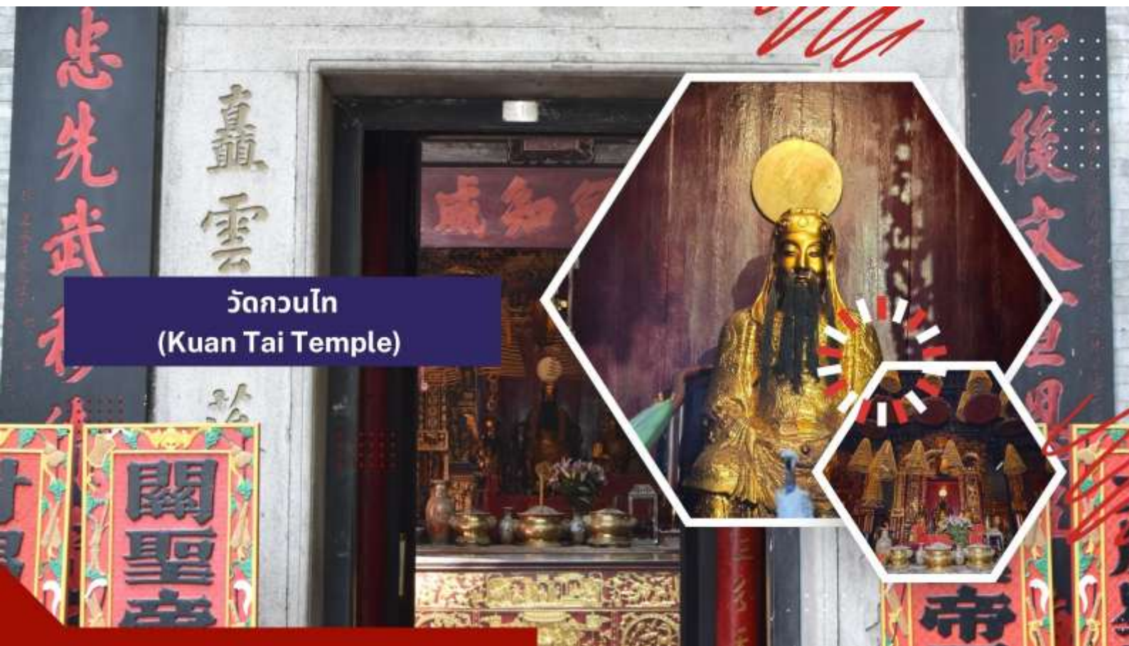
วัดกวนไท (Kuan Tai Temple)

นำท่านเดินทางสู่ วัดกวนไท (Kuan Tai Temple) หรือรู้จักกันในชื่อ วัดซาไถกวยคุน (Sam Kai Vui Kun Temple) เป็นวัดที่มีความสำคัญทางประวัติศาสตร์และวัฒนธรรมในมาเก๊า ได้รับการขึ้นทะเบียนเป็นมรดกโลกของ UNESCO ร่วมกับศูนย์กลางประวัติศาสตร์มาเก๊าในปี ค.ศ. 2005 เนื่องจากคุณค่าทางประวัติศาสตร์ สถาปัตยกรรม และวัฒนธรรมที่โดดเด่น ตั้งอยู่ใจกลางจัตุรัสเซนาโดและรายล้อมไปด้วยอาคารสไตล์ยุโรป วัดนี้สร้างขึ้นเมื่อปี ค.ศ. 1750 และเป็นที่ประดิษฐานของเทพเจ้ากวนอู ซึ่งเป็นเทพเจ้าแห่งความมั่งคั่งและปกป้องคุ้มครอง วัดแห่งนี้มีเป็นที่นิยมของผู้ทำธุรกิจ ตำรวจ และนักการเมือง เพราะเชื่อว่าสามารถปกป้องสิ่งชั่วร้ายต่างๆ และช่วยเสริมอำนาจบาบริในการปกครองและคุ้มครองบริวาร