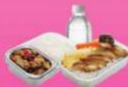
บริการอาหารร้อนบนเครื่อง ซาโป - ซากสับ