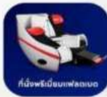
ที่นั่งพร้อมเบาะสำหรับเด็ก

บริการอาหารร้อน และ น้ำดื่ม บนเครื่อง ขาไป และ ขากลับ