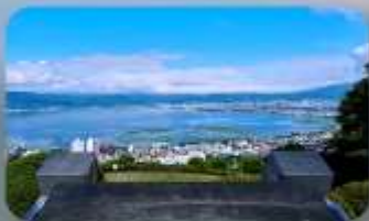
ทะเลสาบสุวะ

INTERNATIONAL RESORT HOTEL YURAKUJO NARITA หรือเทียบเท่ามาตรฐานญี่ปุ่น