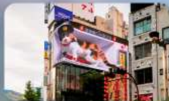
ช้อปปิ้งซินจูกุ