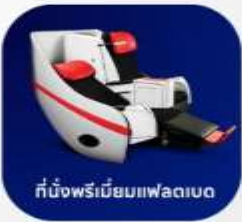
ที่นั่งพรีเมียมแพลตฟอร์ม

บริการอาหารร้อน และ น้ำดื่ม บนเครื่องบิน ขาไป และ ขากลับ