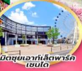
มิตซูเอากะเล็ดพาร์ค เซนได

จุดชมซากุระพันธุ์ต้น ฮิโตะเมะ เซ็มบง ซากุระ