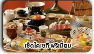
เซตโคเชกิ พรีเมียม