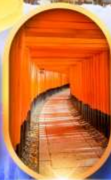
เมืองเก่าทาคายาม่า