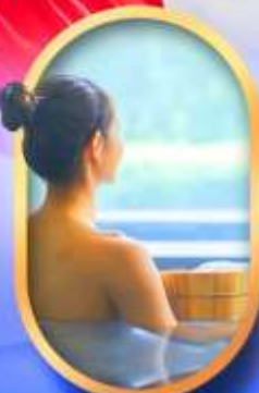
พักโรงแรมออนเซ็น