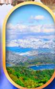
ทะเลสาบมิกะตะ