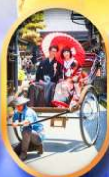
ศาลเจ้าจิ้งจอก