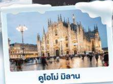
คูโอโม มิลาน