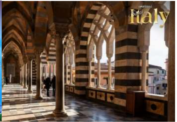
พร้อมใบนัดหมาย 5-7 วันก่อนการเดินทางและขอสงวนสิทธิ์ในการปรับเปลี่ยนที่พักไปเมืองใกล้เคียงในกรณีที่มีเหตุแพร่หรือเทศกาล)