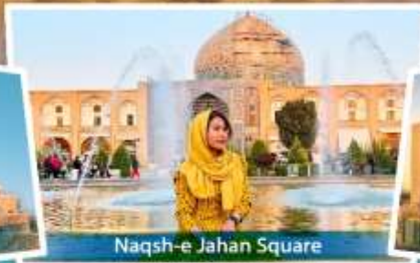
Naqsh-e Jahan Square