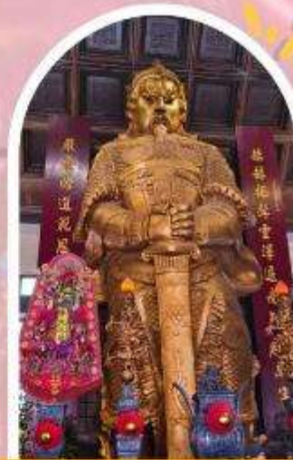
วัดแซกง ขอพรโชคลาก การเงิน และธุรกิจ