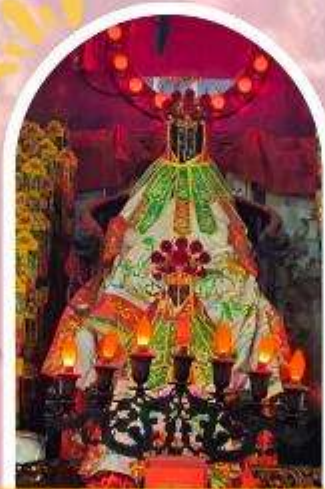
วัดเจ้าแม่กวนอิมอ่องฮำ ขอพรเรื่องเงิน ทรัพย์สิน และความมั่งคั่ง