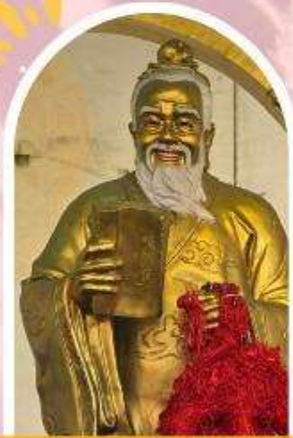
วัดหวังต้าเซียน ขอพรสุขภาพ ความรัก