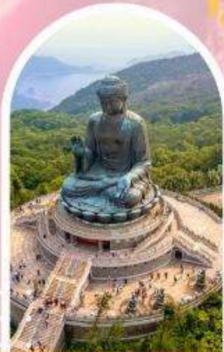
นั่งกระเชานองปิง นมัสการพระใหญ่ไปหกลิน